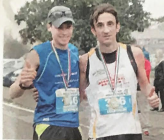
Secondo e terzo classificato alla maratona