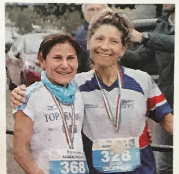
Le prime due classificate alla maratona