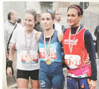
Prime tre classificate alla mezza maratona