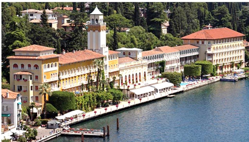
Il Grand Hotel di Gardone Riviera - Sede Congressuale

Giugno è anche – se non soprattutto – il mese del Congresso distrettuale . Il Rotary International vuole che tale appuntamento offra l'opportunità di riallacciare amicizie sopite e di farne di nuove, di incontrare relatori interessanti e di ascoltare discussioni su argomenti rotariani e non. È quello che lo staff ed io abbiamo cercato di fare, attenendoci al suggerimento del Rotary International che esige anche il rinnovamento del modo di fare Rotary , in linea con i mutamenti della società in cui viviamo.